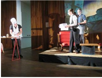
Szenische Lesung von Schloss an der Loire von Roman Sikora beim Festival Ein Stück: Tschechien 2018 in Berlin, Tschechisches Zentrum.

Als Meister der aktuellen politischen Groteske schrieb Roman Sikora sein neuestes Stück Schloss an der Loire (orig. Zámek na Loiře ) als klare Satire auf die heutigen tschechischen politischen Verhältnisse. Im Stück sperrt ein hoher tschechischer Politiker seine Frau auf einem prunkvollen französischen Schloss ein, da sie ihn zu Hause mit ihren Äußerungen in den Medien diskreditiert. Vier Lakaien versuchen zu verstehen, warum sie lieber tschechische Konserven als französische Delikatessen isst und das Rokoko-Schloss im Ikea-Stil neu designt.